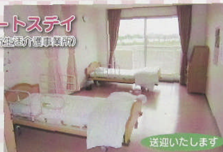
□ショートステイ (短期入所生活介護事業所)

介護認定を受けられ常時介護を必要とする方で、かつ自宅で介護を受けることが困難な方のための入居施設です。