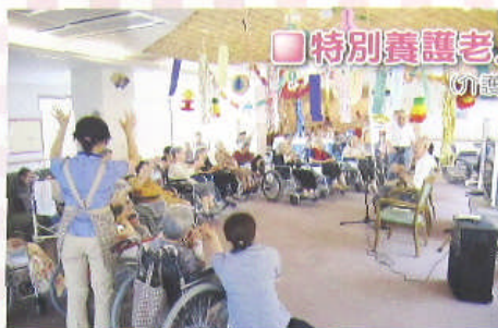
□特別養護老人ホーム (介護老人福祉施設)