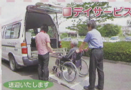
□デイサービスセンター (通所介護事業所)

高齢者を介護されているご家族が病気や冠婚葬祭、旅行などで一時的に介護が出来なくなった時に、一定期間お泊まりいただいて、お世話いたします。